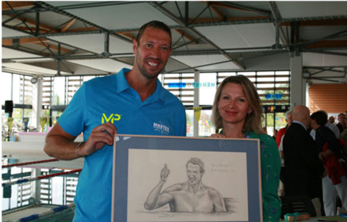
Remise du portrait d'Alain BERNARD, champion olympique de natation