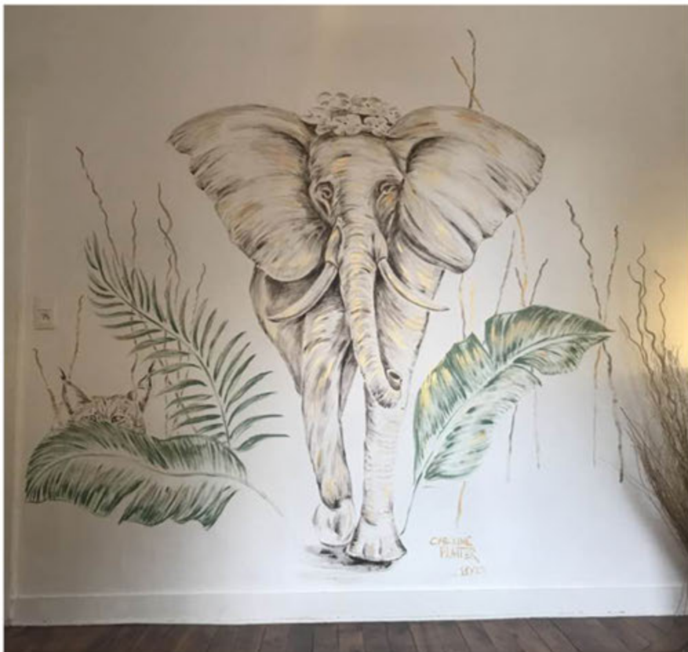
Peinture à main levée