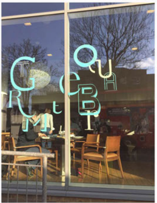
Novotel LONDON Greenwich